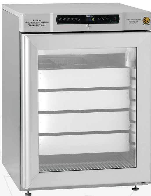
BioCompact II RR210. Lades, glasdeur en vloeistofhouder als optie mogelijk.

De BioCompact II koel- en vrieskasten behoren tot de meest energiezuinige in de markt. Uitwendig in wit of roestvaststaal, inwendig uit één stuk vormgegoten ABS-kunststof vervaardigd met mooie afgeronde hoeken.